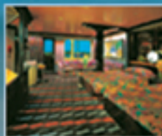
Suite Lujosa con balcón

*Se requiere un depósito de $50 por persona antes de Abril 10, $150 el 5 de Mayo. Pago final: Junio 15, 2003. Reserve ahora, cupo limitado. Fumar a bordo de este crucero es prohibido. Todos los fondos recaudados serán donados a obras benéficas en Villa Sombrero, Bani.