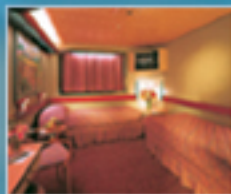
Cabina sin vista al Mar

OPCIONAL: Propina: $68 p/p Seguro: $100 p/p