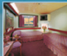
Cabina con vista al Mar