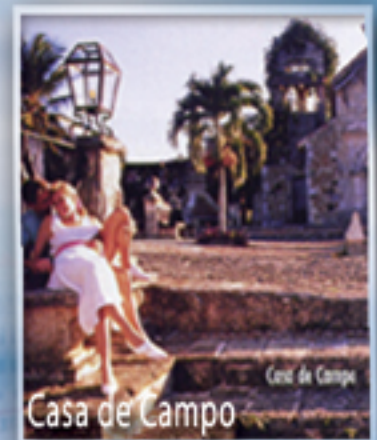
Casa de Campo